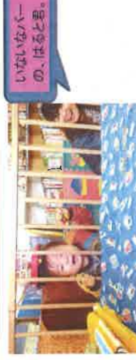
いないいないばらの、はると君。