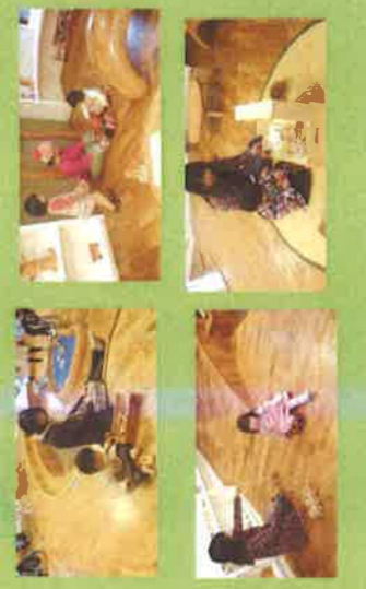
ママと一緒に草 玩具作り