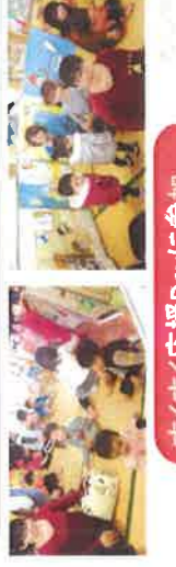
すくすく応援Day!に参加