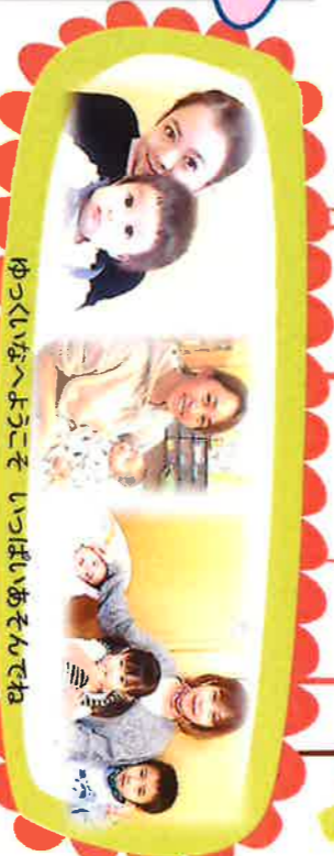
ゆっくいなへようこそ いっぱいあそんでね