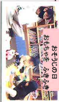
おそろじの日 おもちやをふきふき