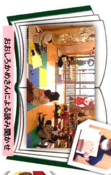
おもしろかめさんによる読み聞かせ