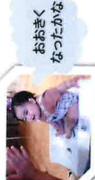
おおきく なったかな