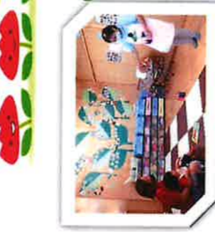
エプロン シアター