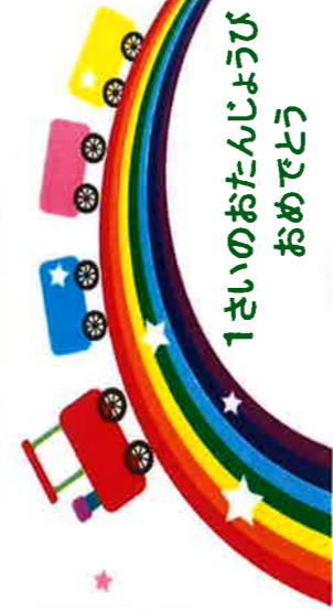
1さいのおたんじょうび おめでとう