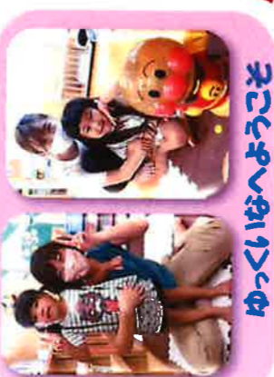
ゆっくいなへようこそ