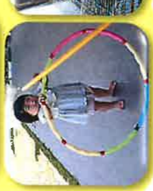
しゃぼんだま♪ フラフープ♪ うさぎさん♪