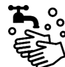
石けんによる 手洗い