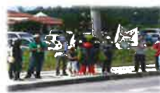
ロードキル防止キャンペーン

・国頭村の自然環境、生態系の保全のため、飼い猫適正飼育事業を実施しました。希少生物であるヤンバルクイナ等の保護につなげています。