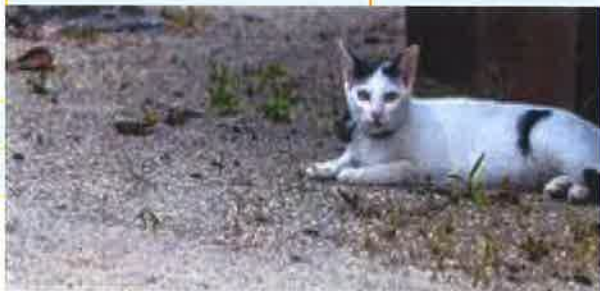
世界自然遺産の登録を目指す国頭村では・・・