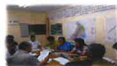
ノイヌ・ノネコ対策会議

国頭村、大宮味村、東村では関係機関や地域住民と連携し、世界遺産候補地としての価値の維持を図るため、ヤンバルクイナなどのロードキル対策、ヤンバルテナゴコガネ、マルバネクワガタなどの密猟防止など野生生物の保護普及啓発活動を進めています。