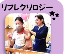
リフレクソロジー