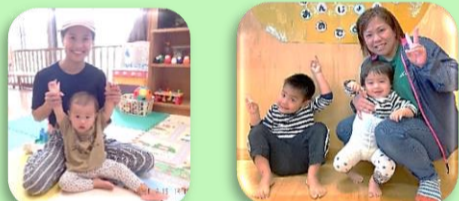
ゆっくいなへ ようこそ♪