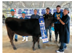
若雌第二類 最優秀賞 三愛牧場 みつゆり号

より能力の高い家畜の生産により、畜産経営の安定化と消費者の食の安全・安心を推進するため、参加した家畜の改良成果を検証する大会です。