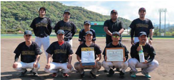
準優勝の国頭村役場チーム