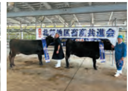
高等登録群 優良賞 三愛牧場 みちこ号 ただみち号