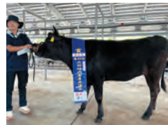
若雌第一類 優良 三愛牧場 せいら号